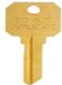
Do Not Duplicate (DND)